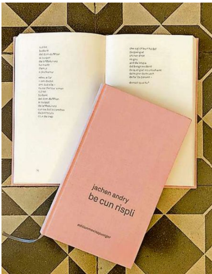
La collecziun «be cun rispli» cumpiglia var 120 poesias valladras.

Zieva bundant quatter minuts es la glüsch darcho turneda our dal ünguotta – precis uschè scu ch'ella d'eira sparida. Surleivg. La gliued ho cumanzo a pager, il ravuogl da cliants s'ho sparpaglio in tuot la butia. Eir eau d'he pajo e sun ieu. E chi so, sch'eu nu vess vis quels duos jets da guerra, nu vessi forsa gieu ün curius sentimaint in quel mumaint.