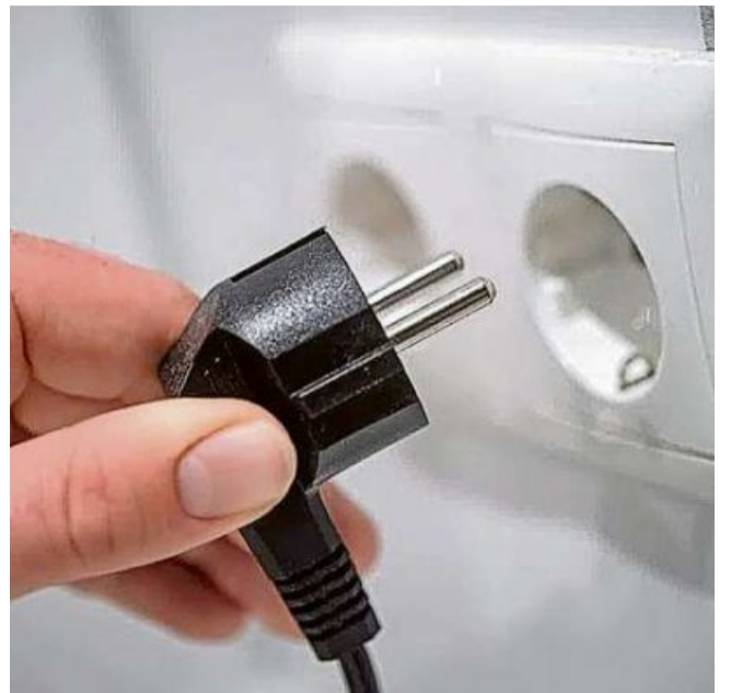
In mardi saira es que per 4 minuts gnieu s-chür in Engiadin'Ota.