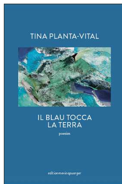
La cuverta dal nov cudesch da poesias da Tina Planta-Vital.